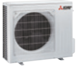
MFZ-KW 50 VGHZ