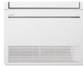
MFZ-KW 25/35/50/60 VG

RETROUVEZ TOUTES LES DONNÉES DE CE PRODUIT EN SCANNANT CE QR CODE